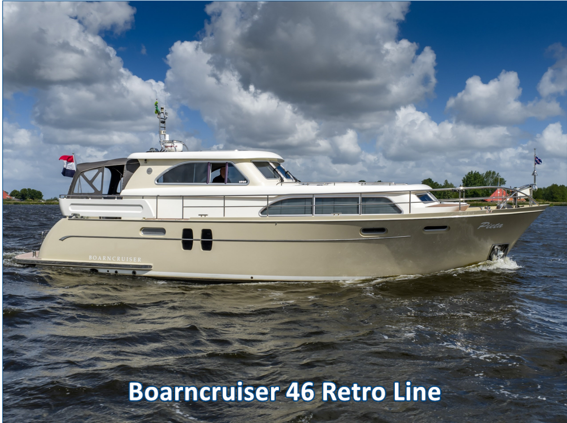
Boarncruiser 46 Retro Line